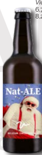
G16937 - 0,75l Birra Nat-Ale Birrificio La Villana, Vicenza 6,72€ (imp.) 8,20€ (ivato)