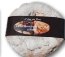
G14932- 500g Torta di fichi, mandorle, uvetta e noci Arte del Pane, Vicenza 5,68€ (imp.) 6,25€ (ivato)