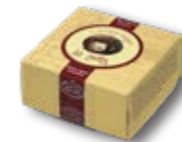
G13253 - 150g Dolce La Gatéa Pasticceria Cortese, Conco 5,32€ (imp.) 5,85€ (ivato)