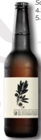
G13475 - 0,5l Birra Piazza delle Erbe Birrificio artigianale Ofelia, Sovizzo 4,34€ (imp.) 5,30€ (ivato)