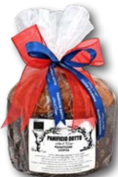
G14924 - 500g Panettone Milano Classico Bio Panificio Dotto, Santorso 15,00€ (imp.) 16,50€ (ivato)