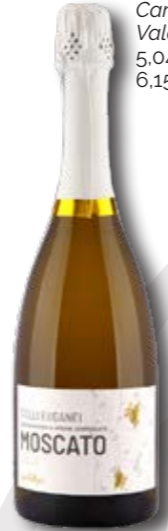
G13545 - 0,75l Moscato dolce DOC Cantine Soldà, Valdagno 5,04€ (imp.) 6,15€ (ivato)