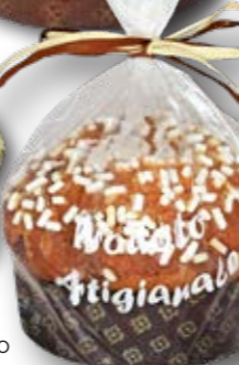
G14922 - 600g Veneziana con crema alla nocciola Arte del Pane, Vicenza 11,27€ (imp.) 12,40€ (ivato)