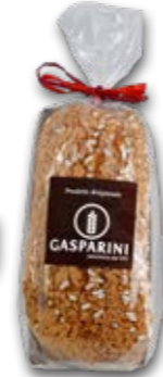
G14228 - 500g Tronchetto ai frutti di bosco Panetteria Gasparini, Piovene Rocchette 11,68€ (imp.) 12,85€ (ivato)