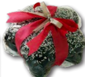
G13290 - 500g Fiocco di neve Panificio Righetto, Barbarano 9,27€ (imp.) 10,20€ (ivato)