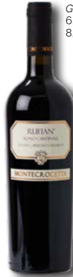
G13549 - 0,75l Rufian rosso IGT Vini Maule, Gambellara 6,97€ (imp.) 8,50€ (ivato)