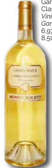
G13514 - 0,75l Santa Marie Gambellara Classico Vini Maule, Gambellara 6,97€ (imp.) 8,50€ (ivato)