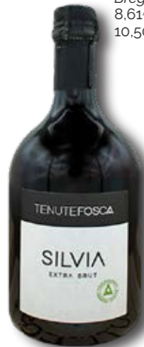
G16480 - 0,75l Silvia spumante extra brut bio Tenutefosca, Breganze 8,61€ (imp.) 10,50€ (ivato)