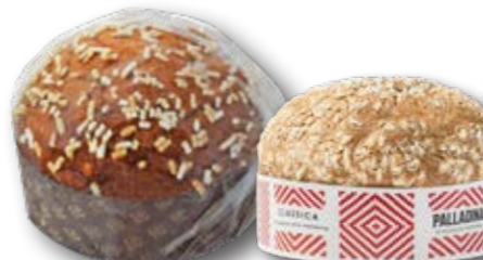
G19814 - 500g Veneziana con lievito madre Pan dei Roveri, Villaverla 11,36€ (imp.) 12,50€ (ivato)