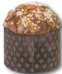
G14923 - 500g Panettone classico con lievito madre Pan dei Roveri, Villaverla 15,45€ (imp.) 17,00€ (ivato)