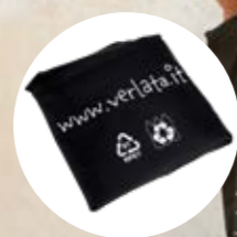
VL317 Borsetta 100% da bottiglie di plastica riciclata 4,10€ (imp.) 5,00€ (ivato)

Idea regalo? La nostra borsetta a doppia sostenibilità: ambientale e sociale