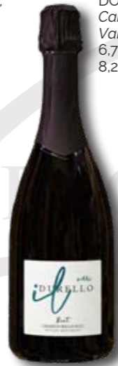
G16479 - 0,75l Durello Lessini Spumante DOC Brut Cantine Soldà, Valdagno 6,72€ (imp.) 8,20€ (ivato)