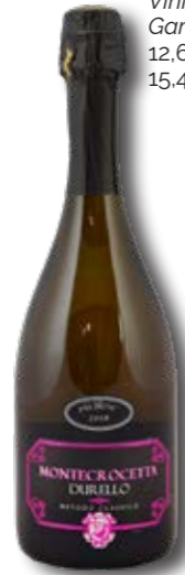
G14550 - 0,75l Durello VSQ Metodo Classico Vini Maule, Gambellara 12,62€ (imp.) 15,40€ (ivato)