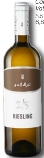
G13512 - 0,75l Riesling Cantine Soldà, Valdagno 5,57€ (imp.) 6,80€ (ivato)