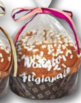
G14926 - 600g Veneziana con pere e cioccolato Arte del Pane, Vicenza 13,91€ (imp.) 15,30€ (ivato)