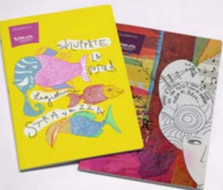
VL242 Quaderno A4 cm 21x30 4,51€ (imp.) 5,50€ (ivato)