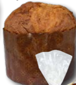
G14931 - 750g Panettone con gocce di frutti di bosco Panificio Righetto, Barbarano 16,82€ (imp.) 18,50€ (ivato)