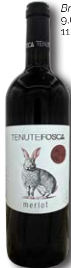
G14593 - 0,75l Merlot Tenutefosca, Breganze 9,67€ (imp.) 11,80€ (ivato)