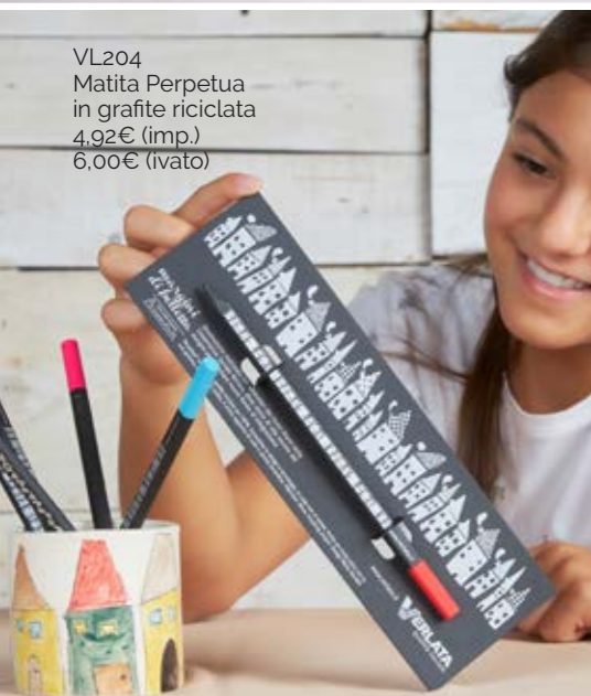
VL204 Matita Perpetua in grafite riciclata 4,92€ (imp.) 6,00€ (ivato)

Idea regalo? La nostra borsetta a doppia sostenibilità: ambientale e sociale