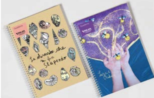
VL201 Quaderno A5 cm 15x21 2,95€ (imp.) 3,60€ (ivato)