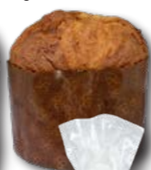
G14930 - 500g Panettone con gocce di frutti di bosco Panificio Righetto, Barbarano 11,18€ (imp.) 12,30€ (ivato)