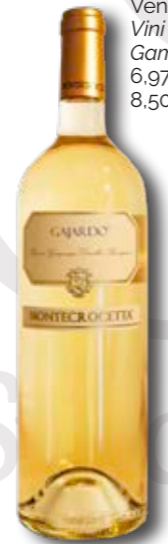
G13550 - 0,75l Gajardo Bianco Veneto IGT Vini Maule, Gambellara 6,97€ (imp.) 8,50€ (ivato)