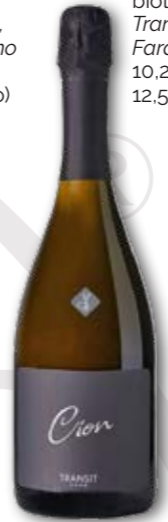
G13479 - 0,75l Cion spumante brut rosé biologico Transit Farm, Fara Vicentino 10,29€ (imp.) 12,55€ (ivato)