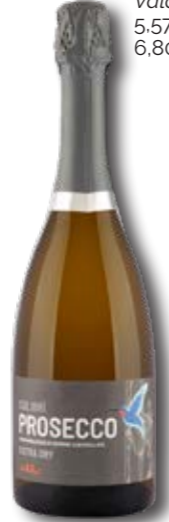
G13544 - 0,75l Prosecco Colibri Cantine Soldà, Valdagno 5,57€ (imp.) 6,80€ (ivato)