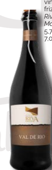
G13140 - 0,75l Val de Rio vino bianco frizzante Riva Granda, Molvena 5,74€ (imp.) 7,00€ (ivato)