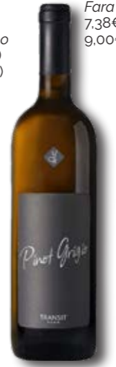
G15478 - 0,75l Pinot Grigio Transit Farm, Fara Vicentino 7,38€ (imp.) 9,00€ (ivato)