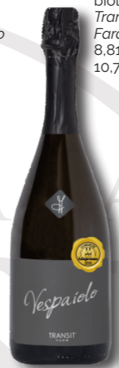
G13478 - 0,75l Vespaiolo DOC spumante biologico Transit Farm, Fara Vicentino 8,81€ (imp.) 10,75€ (ivato)