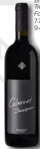
G16478 - 0,75l Cabernet Sauvignon Breganze Transit Farm, Fara Vicentino 7,70€ (imp.) 9,40€ (ivato)