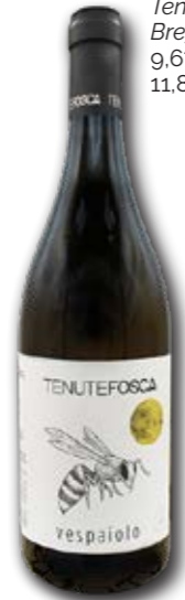
G14952 - 0,75l Vespaiolo Tenutefosca, Breganze 9,67€ (imp.) 11,80€ (ivato)