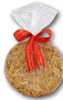
G16917 - 250g Sbrisolona Bio Panificio Dotto, Santorso 4,91€ (imp.) 5,40€ (ivato)