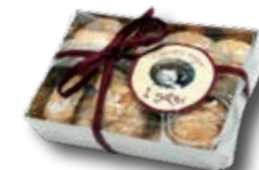
G13214 - 100g Nuvole di Mandorle Pasticceria Gambarato, Vicenza 5,59€ (imp.) 6,15€ (ivato)